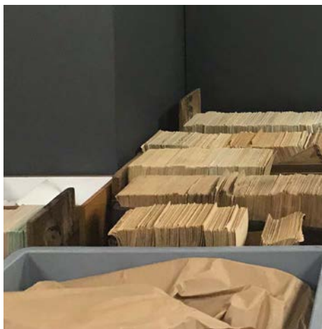
Nomenclature par fiches.