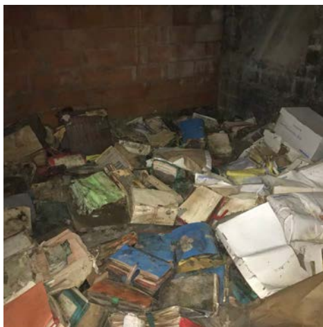
Archives après une inondation.